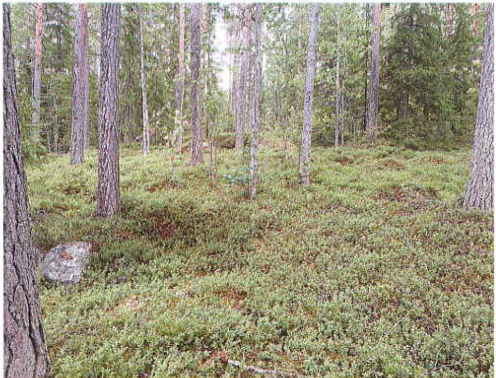
Kuva Orametsä- tilan tonttialueelta

Yleiskaava- ja ranta- asemakaavatilanne on esitelty kohdassa 2.1.