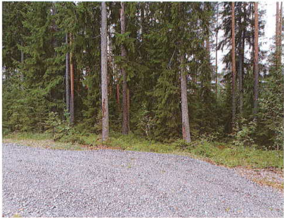
Puusto on osaksi varsin suurta

Kaavassa oleva pinta-ala jakautuu siten, että loma- asuntojen korttelialuetta (RA) on 1,3780 hehtaaria sekä maa- ja metsätalousaluetta (M) 4,6179 hehtaaria.