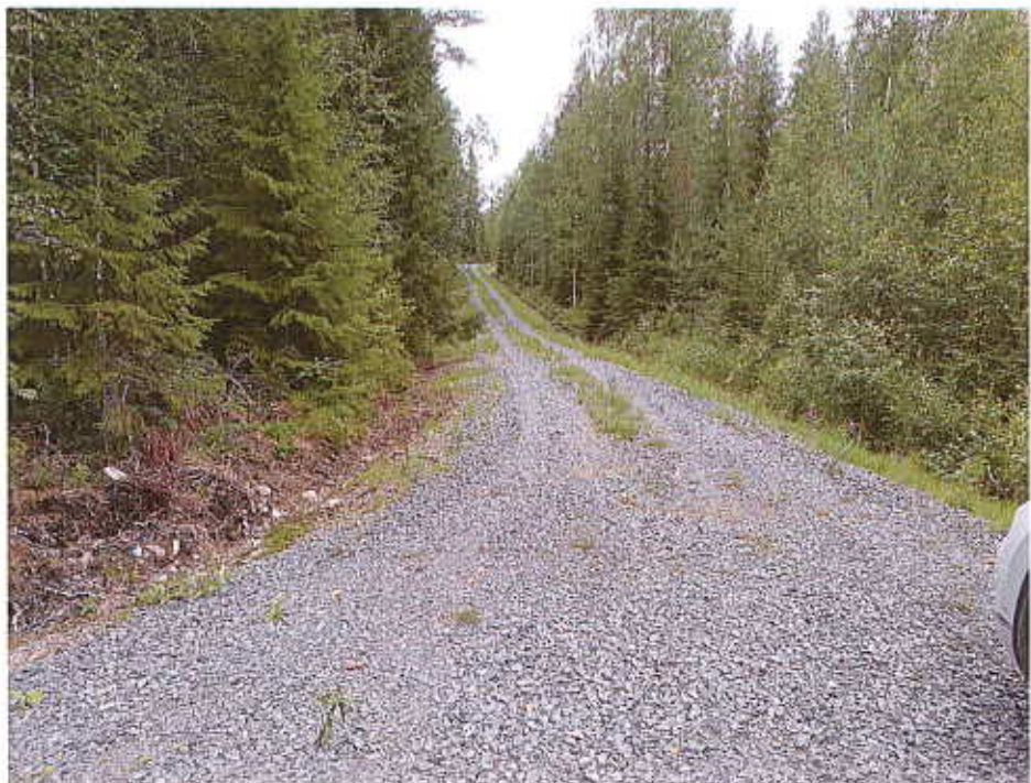
Sarvansaaren alueen tonttitie

Kaava-alueen toteutumisen liikenteellinen merkitys on vähäinen. Kaikille rakennuspaikoille ovat tiet valmiina.