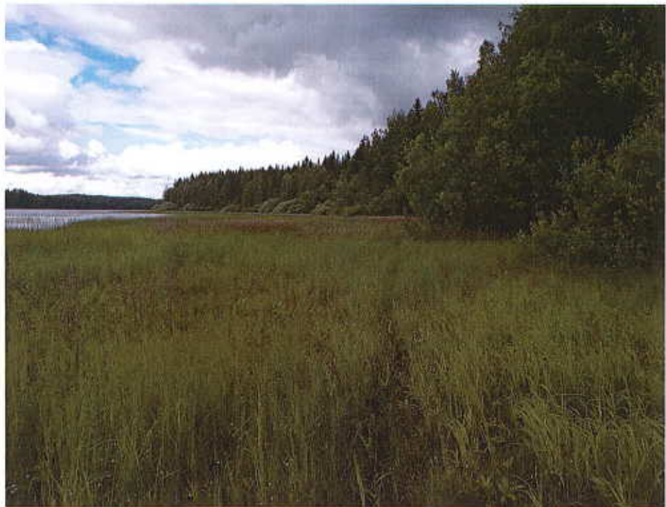
Kuvassa on Sarvansaaren alueen rantaa

Yksityishenkilö teki 23.4.2021 päivätyn muistutuksen.